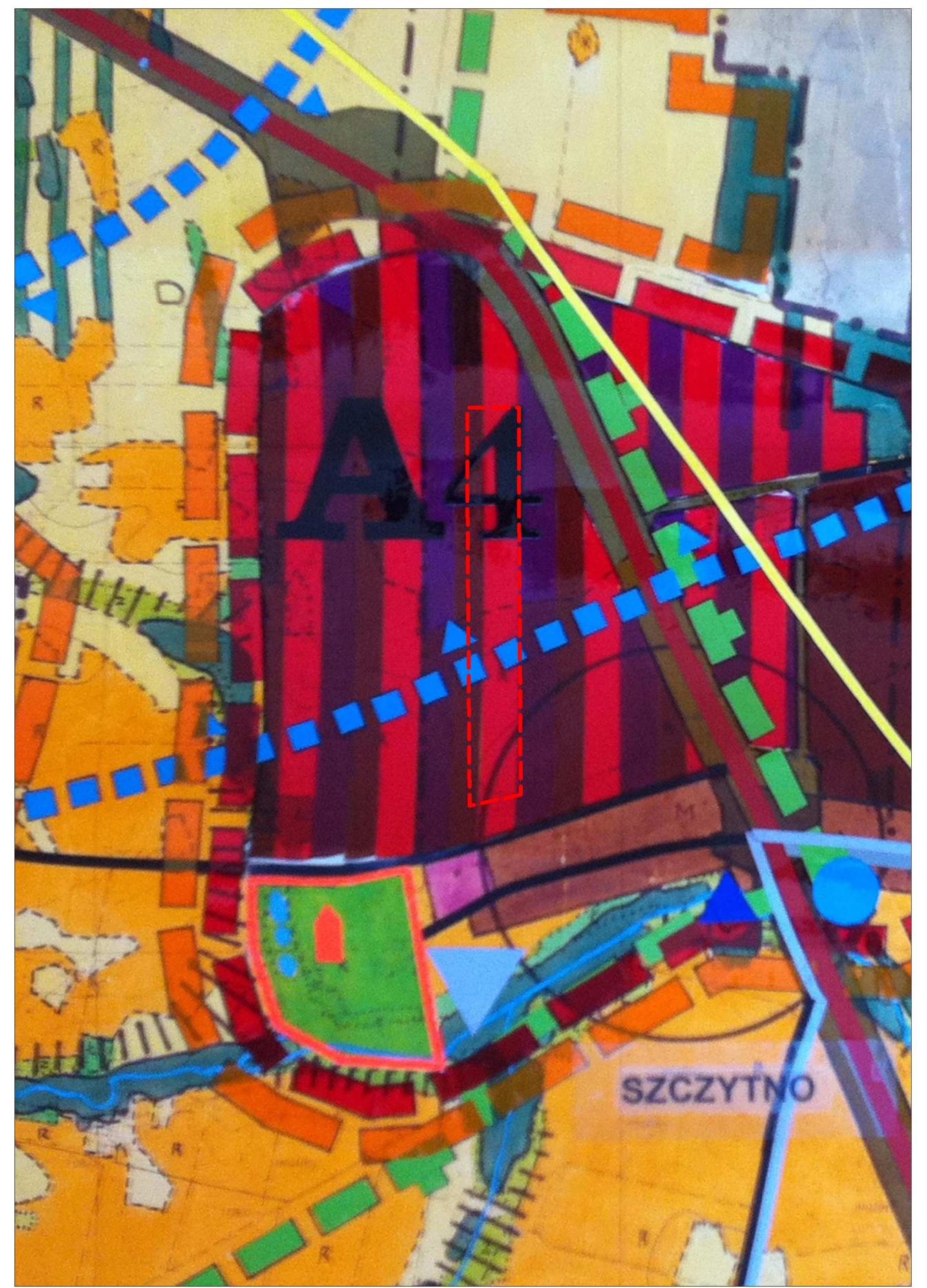
Wyrzys ze Studium uwarunkowań i kierunków zagospodarowania przestrzennego gminy Załuski skala 1:10 000