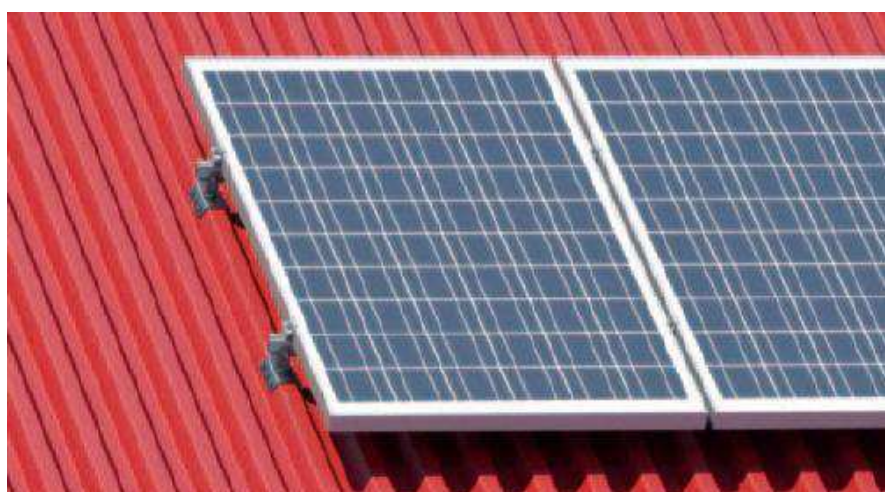
Fotografia. Montaż paneli PV pionowy na dachu krytym blachą trapezową