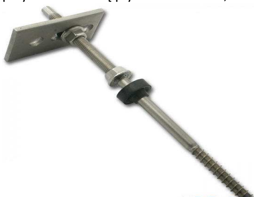
Fotografia. Wkręt dokrokwiowy

Blachodachówka jest pokryciem pełnym, w całości zasłaniającym więźbę dachową. W przeciwieństwie do dachówek ceramicznych, nie ma możliwości odsłonięcia fragmentów krokwi przez czasowe podniesienie pokrycia. Bardzo ważne jest więc dokładne określenie położenia belek krokwiowych przed montażem. Główne uchwyty dla montażu profili wielorowkowych (szyn montażowych) stanowią tzw. wkręty dokrokwiowe (fot.). Wkręty produkowane są o różnych długościach i średnicach śrub, np. 10x200, 10x250, 12x300mm. Do wkrętów przymocowane są płytki montażowe, do którym w dalszej kolejności przykręca się szyny.