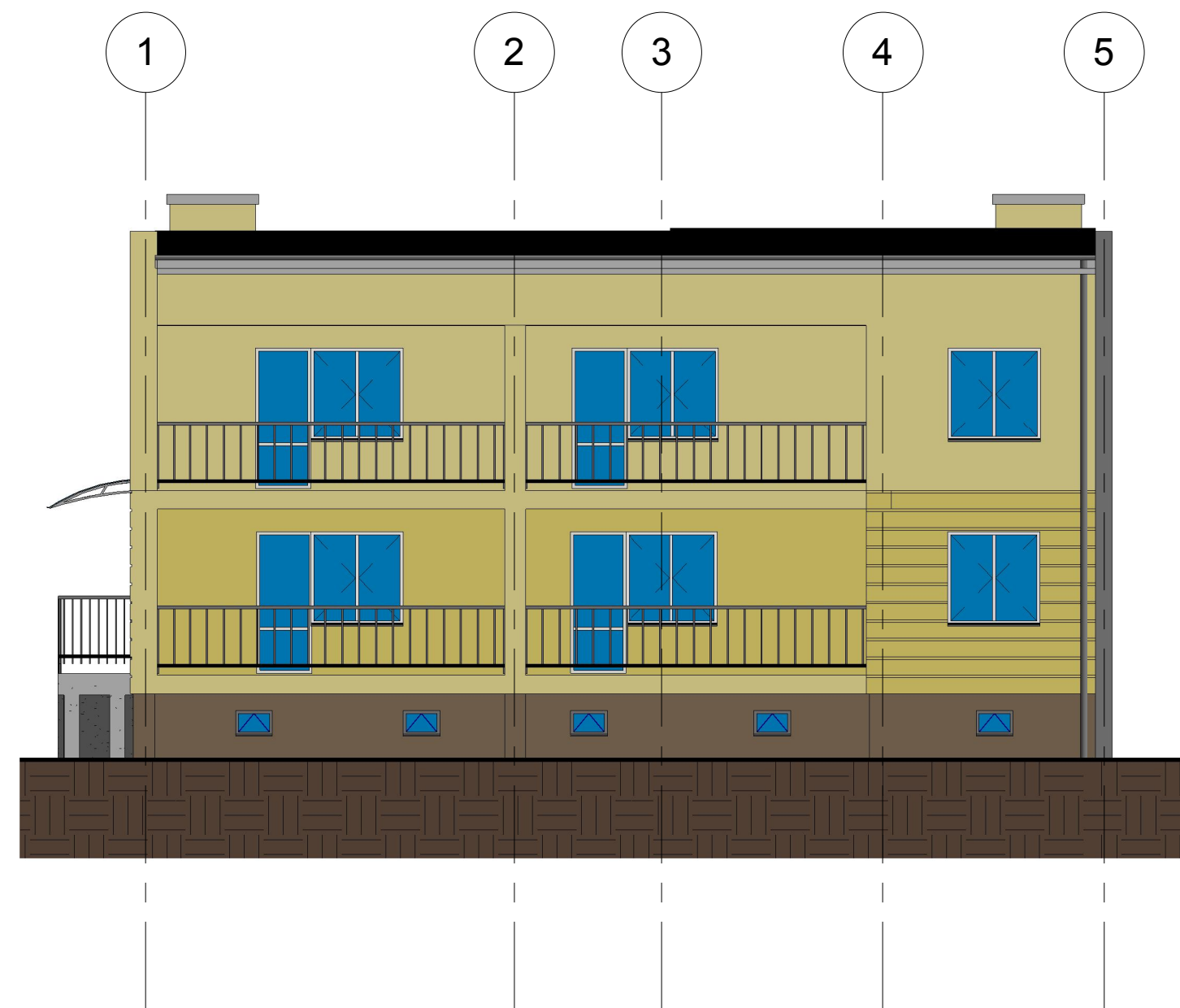
4 Zachód 1 : 100