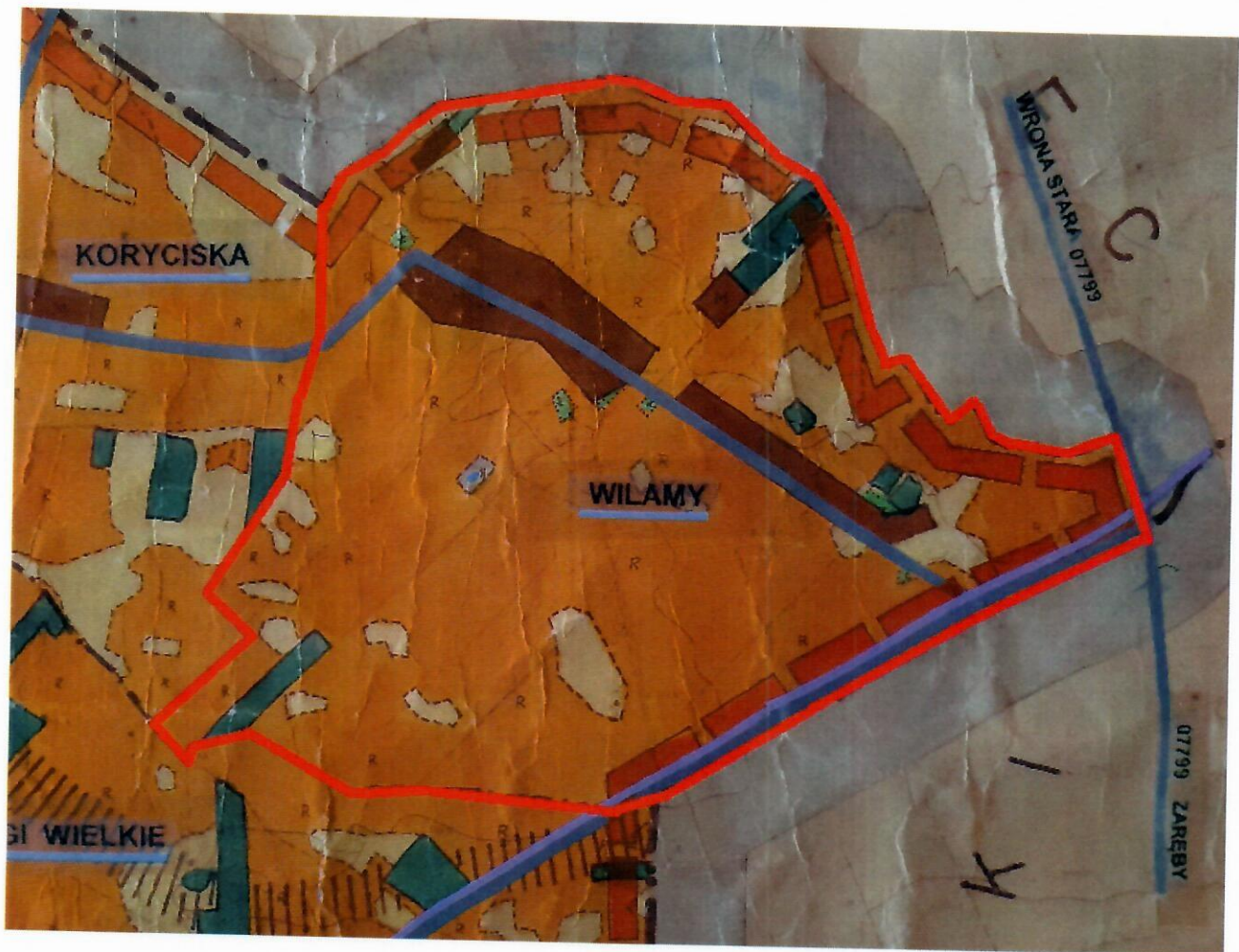
Orientacyjna granica obszaru objętego przystąpieniem do sporządzenia miejscowego planu zagospodarowania przestrzennego Gminy Załuski dla terenu wsi Wilamy na fragmencie rysunku Studium uwarunkowań i kierunków zagospodarowania przestrzennego gminy Załuski.

Zgodnie z zapisami w Załączniku nr 3 do uchwały nr 182/XXIX/2002 Rady Gminy w Załuskach z dnia 24 kwietnia 2002 r. w sprawie uchwalenia studium uwarunkowań i kierunków zagospodarowania przestrzennego gminy Załuski: