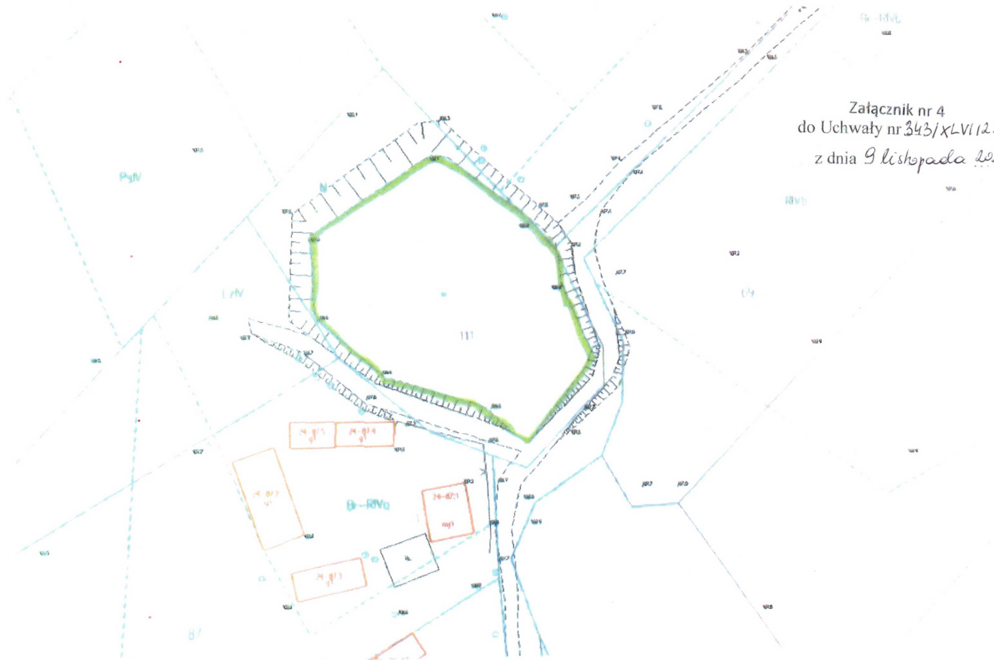
Zbiornik wodny w Wilamach

Załącznik nr 4 do Uchwały nr 343/XLVI/22 z dnia 9 listopada 2022 r.